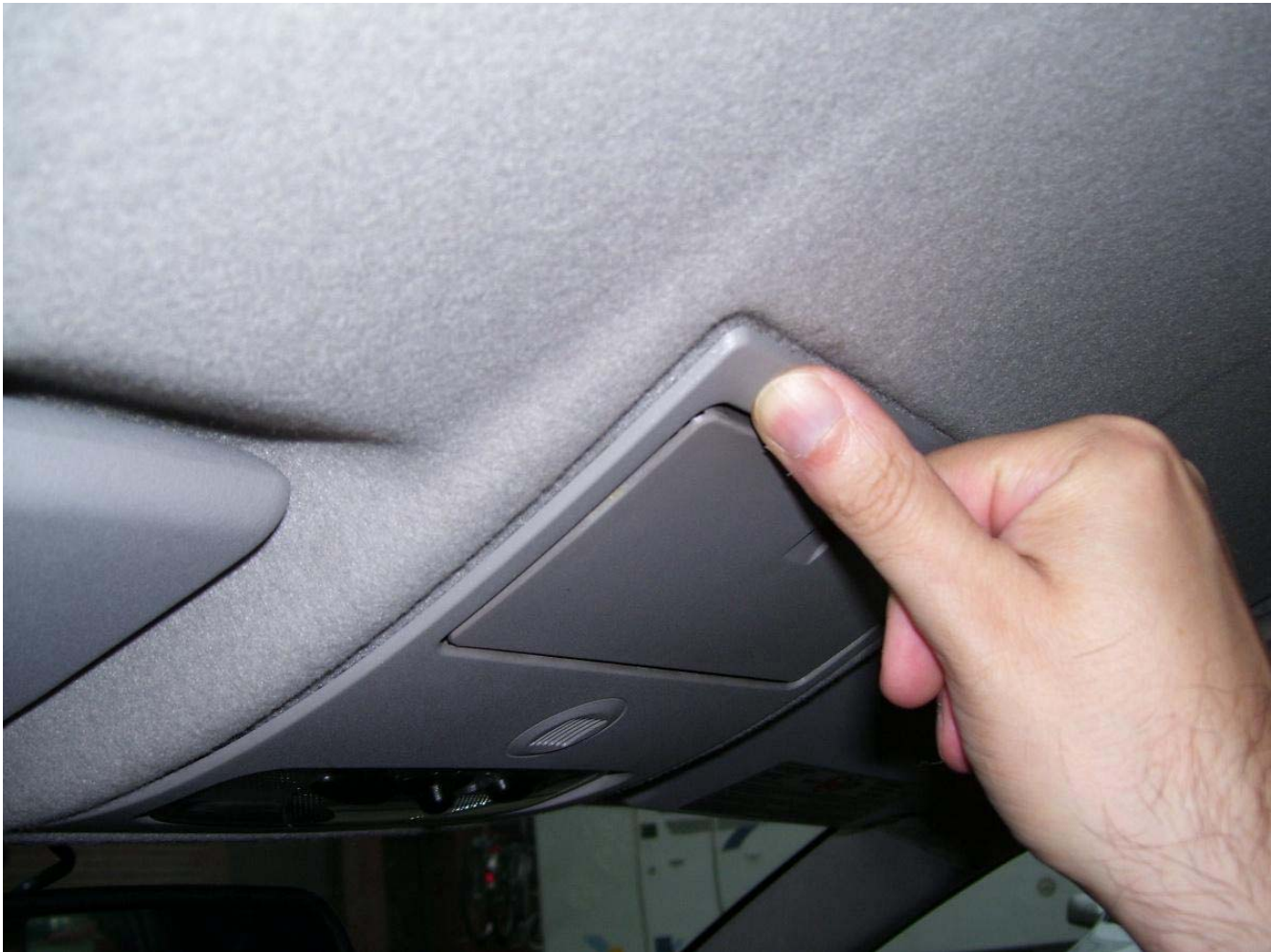
Bild 3 (besser 1 Daumen rechts, 1 Daumen links und gleichzeitig Richtung Dach drücken)

Rahmen so halten wie in Bild 2 und beide schwarze Stecker aufstecken. Rahmen auch an der vorderen Seite nach oben drücken. Am besten genau an den Stellen, hinter denen sich die grauen Ösen befinden. Am besten macht man das mit 2 Daumen. In Bild 3 ist nur die rechte Hand zu sehen, weil die linke Hand zum fotografieren benutzt wurde.